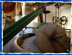
CENTRO CULTURAL CORTIJO DE MIRAFLORES. MARBELLA